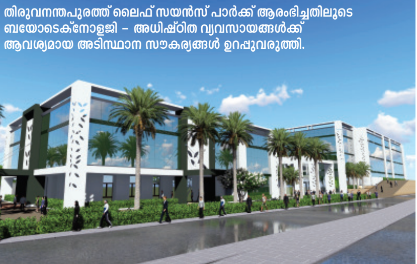
തിരുവനന്തപുരത്ത് ലൈഫ് സയൻസ് പാർക്ക് ആരംഭിച്ചതിലൂടെ ബയോടെക്നോളജി - അധിഷ്ഠിത വ്യവസായങ്ങൾക്ക് ആവശ്യമായ അടിസ്ഥാന സൗകര്യങ്ങൾ ഉറപ്പുവരുത്തി.

കേരളത്തെ തൊഴിലാളി - നിക്ഷേപക സൗഹൃദമാക്കാൻ പുതിയ