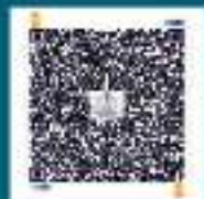
സംഭാവന നൽകാനുള്ള QR Code