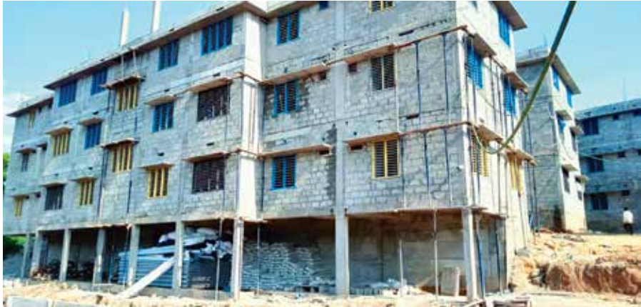
പെരിന്തൽമണ്ണ മുനിസിപ്പാലിറ്റി പൈലറ്റ് ഭവനസമുച്ചയ നിർമ്മാണം ഭവനങ്ങളുടെ എണ്ണം - 400