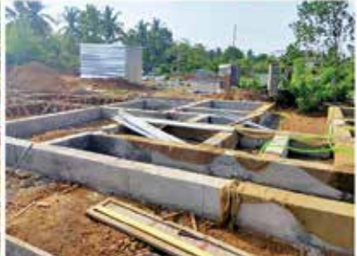
കണ്ണൂർ - കടമ്പൂർ ഗ്രാമപഞ്ചായത്ത് - പൈലറ്റ് ഭവനസമുച്ചയ നിർമ്മാണം ഭവനങ്ങളുടെ എണ്ണം - 44, ഫൗണ്ടേഷൻ നിർമ്മാണം അവസാന ഘട്ടത്തിൽ