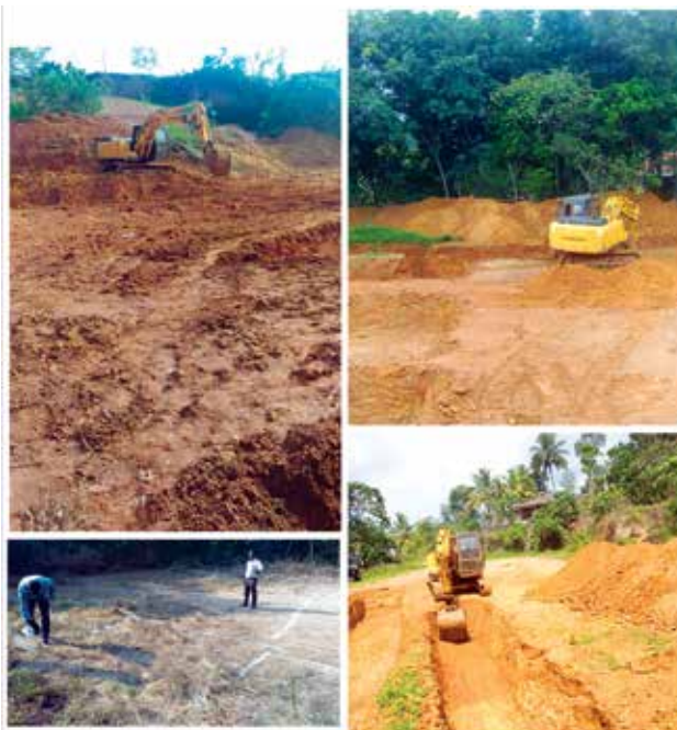
കോട്ടയം - വിജയപുരം ഗ്രാമപഞ്ചായത്ത് പൈലറ്റ് ഭവനസമുച്ചയ നിർമ്മാണം ഭവനങ്ങളുടെ എണ്ണം - 44 എർത്ത് വർക്ക് പൂരോഗമിക്കുന്നു.