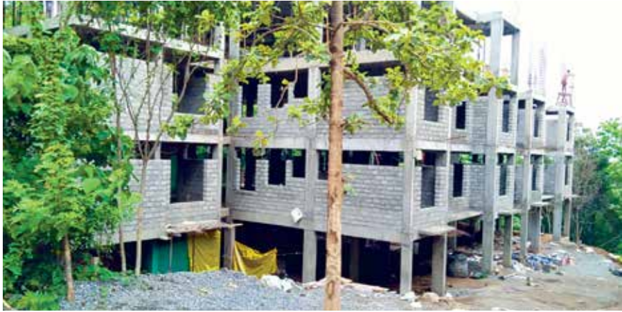
വടക്കാഞ്ചേരി മുനിസിപ്പാലിറ്റി പൈലറ്റ് ഭവനസമുച്ചയ നിർമ്മാണം ഭവനങ്ങളുടെ എണ്ണം - 140