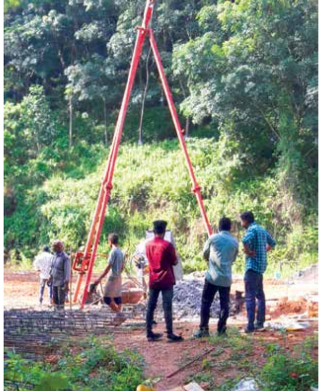
കൊല്ലം - പുനലൂർ മുനിസിപ്പാലിറ്റി പൈലറ്റ് ഭവനസമുച്ചയ നിർമ്മാണം ഭവനങ്ങളുടെ എണ്ണം - 44 പൈലിംഗ് ജോലികൾ പൂരോഗതിയിൽ