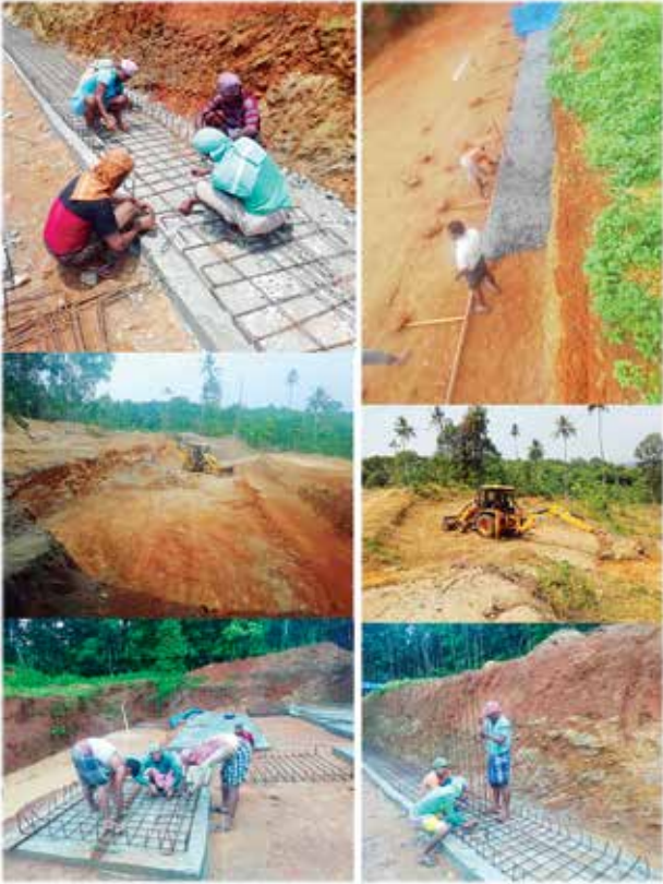
ഇടുക്കി - കുരിമണ്ണൂർ ഗ്രാമപഞ്ചായത്ത് പൈലറ്റ് ഭവനസമുച്ചയ നിർമ്മാണം ഭവനങ്ങളുടെ എണ്ണം - 44 ഫൗണ്ടേഷൻ നിർമ്മാണം പൂരോഗമിക്കുന്നു