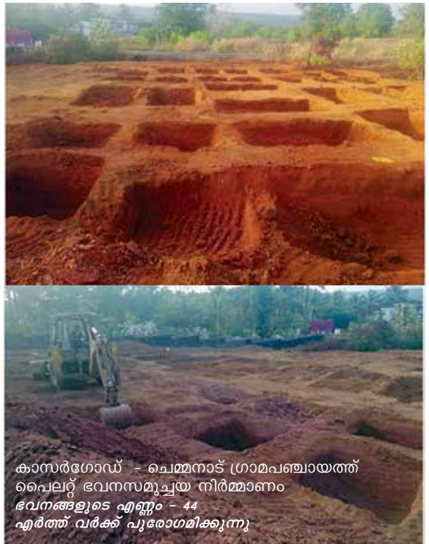
കാസർഗോഡ് - ചെമ്മനാട് ഗ്രാമപഞ്ചായത്ത് പൈലറ്റ് ഭവനസമുച്ചയ നിർമ്മാണം ഭവനങ്ങളുടെ എണ്ണം - 44 എർത്ത് വർക്ക് പൂരോഗമിക്കുന്നു